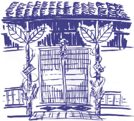
一番街創作門松 スケッチ:青山恭之

*休館および観覧料等は変更になる場合があります。 *詳しくは、各施設等にお尋ねください。